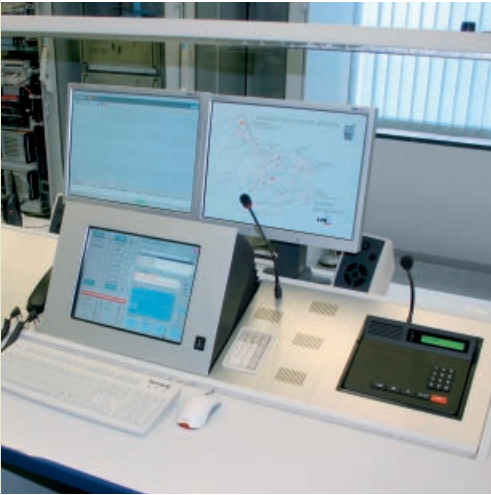
Monitorebene mit in Höhe und Neigung verstellbaren TFT-Displays sowie Touchscreen