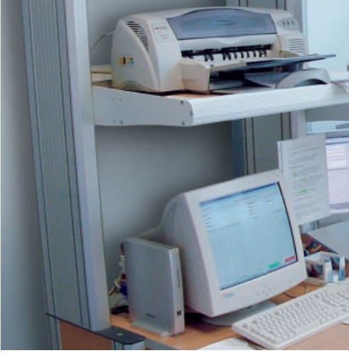
Systemebene z.B. Druckerboard