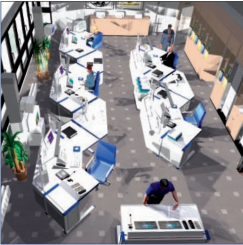
Fotorealistische 3D-Planung nach Vorgaben