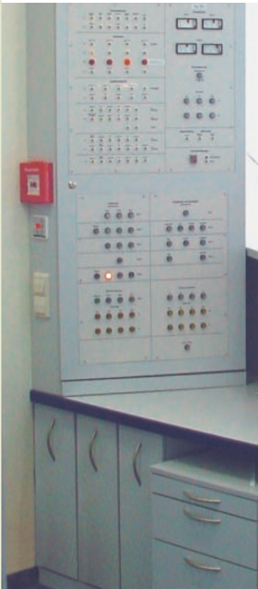
Individuelle Organisationsauszüge und komplett verdrahtete und geprüfte Tableaus mit Gravur, Siebdruck oder Unterrelaxdruck