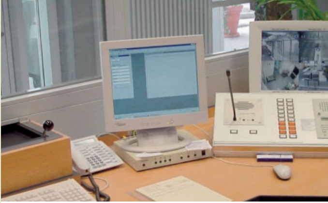
Individuell gestaltete Pforte mit integrierter Schiebemulde und ZBe - Zentrale Bedieneinheit